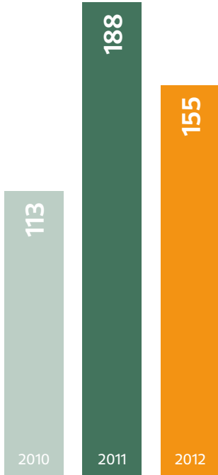
KONSOLİDE (UFRS Milyon ABD Doları)

Grubun 2012 yılı konsolide faiz, vergi ve amortisman öncesi kârı (FVAÖK), 155 milyon ABD doları olarak gerçekleşmiştir.